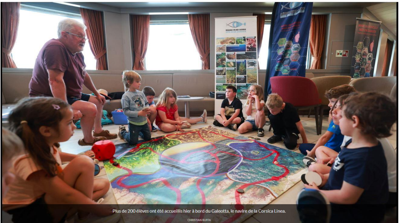
Plus de 200 élèves ont été accueillis hier à bord du Galeotta, le navire de la Corsica Linea.